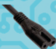
FÊMEA TIPO 8