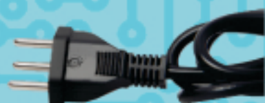
RABICHO LUMINÁRIA COM PLUG INJETADO